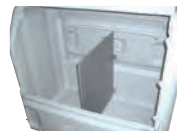
⑥仕切板 部材+取付費 18,190円(税抜)

※上記の値段に部材と取付費は含まれています。 上記は工場にて取り付けて出荷した時の価格(取付費)です。 部材のみ発送の場合は別途送料がかかります。 後付けの場合はリベット工具が必要です。