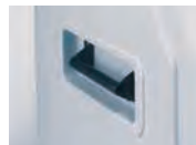
③小型ハンドル 部材+取付費 6,060円(税抜)