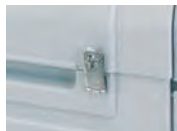
①鍵止め金具 部材+取付費 2,430円(税抜)