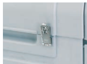
①鍵止め金具 部材+取付費 2,210円(税抜)