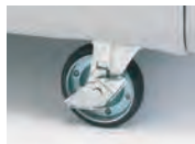
②大口径車輪 部材+取付費 16,980円(税抜)