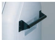
④大型ハンドル 部材+取付費 16,540円(税抜)