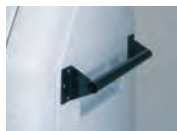
④大型ハンドル 部材+取付費 18,190円(税抜)