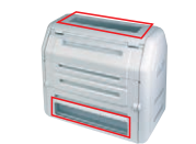
⑤透明窓(2ヶ所) 部材+取付費 33,080円(税抜)