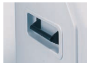
③小型ハンドル 部材+取付費 5,510円(税抜)