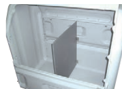
⑥仕切板 部材+取付費 16,540円(税抜)

※上記の値段に部材と取付費は含まれています。 上記は工場にて取り付けて出荷した時の価格(取付費)です。 部材のみ発送の場合は別途送料がかかります。 後付けの場合はリベット工具が必要です。