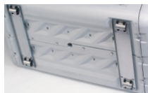
据え置き仕様 本体価格 103,600円(税抜)