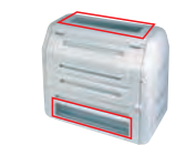
⑤透明窓(2ヶ所) 部材+取付費 36,390円(税抜)