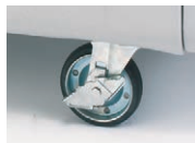
②大口径車輪 部材+取付費 15,440円(税抜)